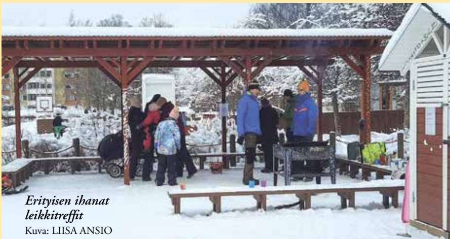
Erityisen ihanat leikkitreffit