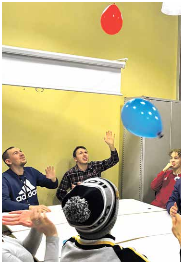
TUU MUKAAN -teksti: MAIJU RANTANEN Kuvat: MILLA KOSKELA, TERHI NISUMAA ja VIIVI PESSI