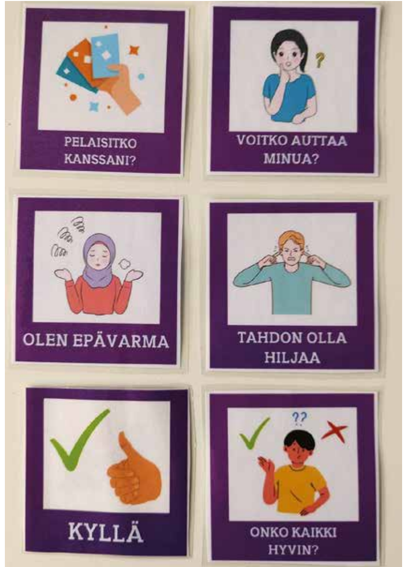
Milla on oppinut muun muassa erilaisia kommunikaatiomuotoja ja tehnyt kommunikaatiokortteja.