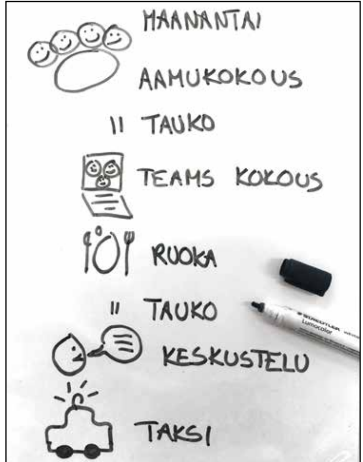
Yläkuvassa päiväjärjestyksen tulkkaukset, alla opiskelutulkkauksen apuvälineitä.

Puhevammainen henkilö on myös oikeutettu tulkkaukspalveluun aloittaessaan opinnot perusopinnot jälkeen. Opiskelutulkkaus on maksutonta asiakkaalle. Opiskelutulkkauksen päätös haetaan Kelalta siinä vaiheessa, kun opiskelupaikka oppilaitoksessa on vahvistunut. Kela hoitaa tulkin etsimisen.