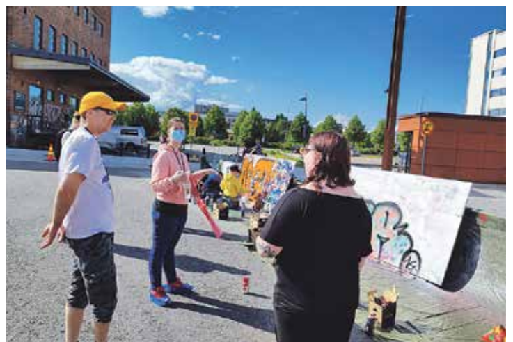
Taidfest '22 aikana nuoret pääsivät mm. kokeilemaan graffitimaalausta Lutakon aukiolla.