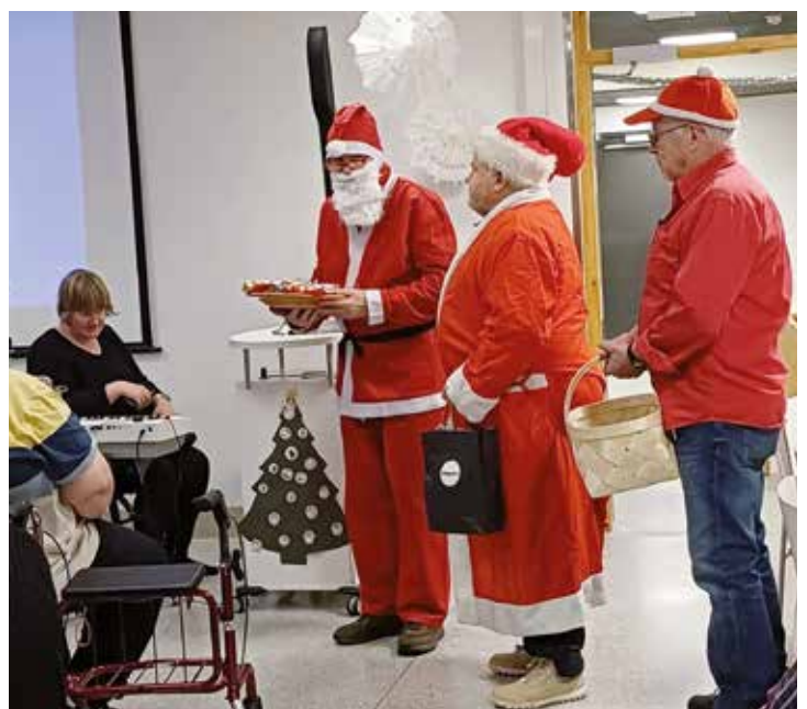
Joulupukit lahjoineen ovat lähteneet liikkeelle.