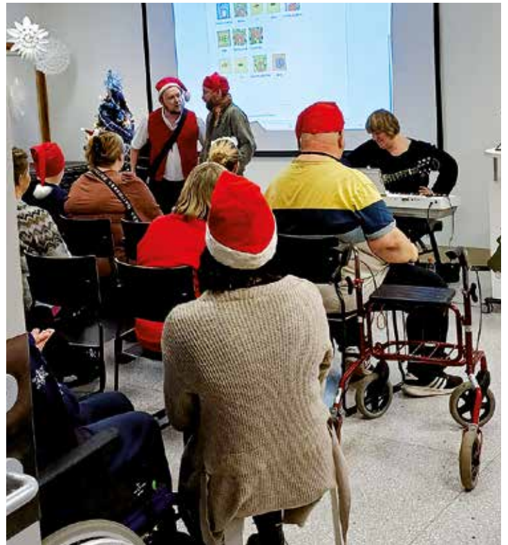
Loihun Tontut Toivo ja Ton

Kaikki mitä ns. ”vanhan ajan pikkujouluissa” tarvitaan. Laulua, leikkimielitä, tontut torveilemassa ja vielä joulupukkeja. En vuosiin ole nauttinut niin paljon.”