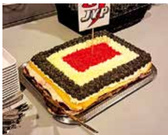
Vierailun päätteeksi Kisko-kahvilan väen leipoma Jyp-kakku.