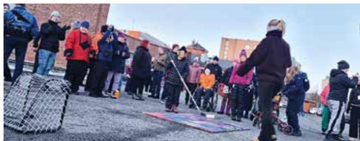
Tuu mukaan nuoria laukomassa lämäreitä maaliin.

todella mieluinen. Ryhmän ohjaajien näkökulmasta oli hienoa huomata, kuinka hyvin nuoret ottivat huomioon kaverit, jotka eivät päässeet paikalle tapaamaan pelaajia: nimmareita pyydettiin muutama ylimääräinen ja toimitettiin eteenpäin kavereille, jotta kukaan ei jäisi paitsi.