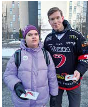
Tarra muistoksi mukavasta vierailusta.