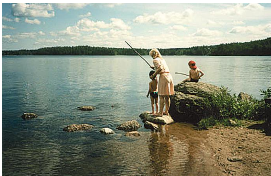
Onkikalastus kuuluu kesän iloihin.