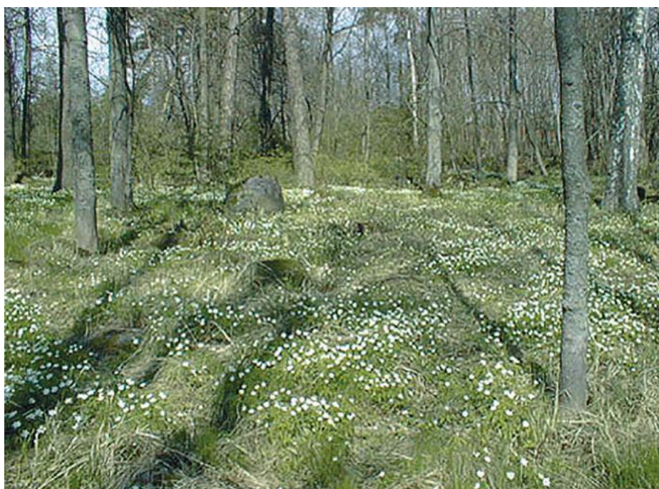
Kevätmetsä ja valkovuokot.