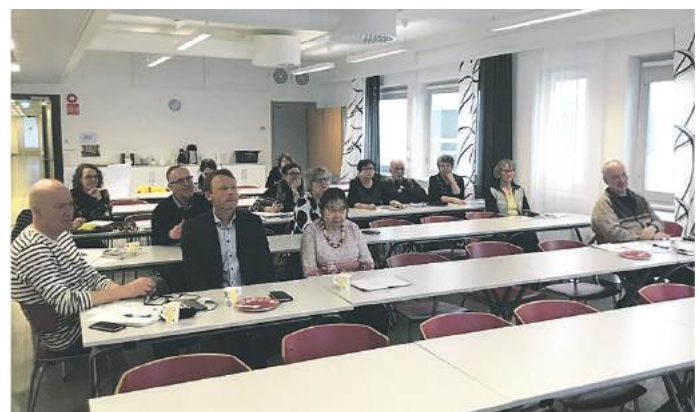
"Mitä voisimme tehdä yhdessä?"