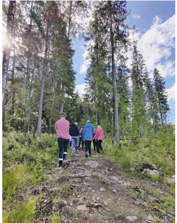
Metsälaulukävely vei Sääsksvuoren palvelukodin väen myyttiseen metsään. Tiesitkö, että sadut ja tarinat alkavat jo kotipihasta?