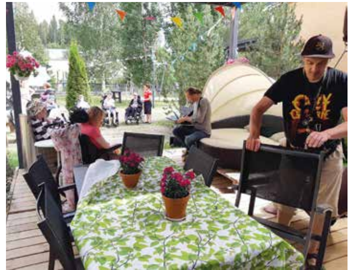
Kulttuuripisaroissa yhteinen tekeminen on tärkeää. Ritoniityssä lauluiksi muuttuivat kesäiset asiat.